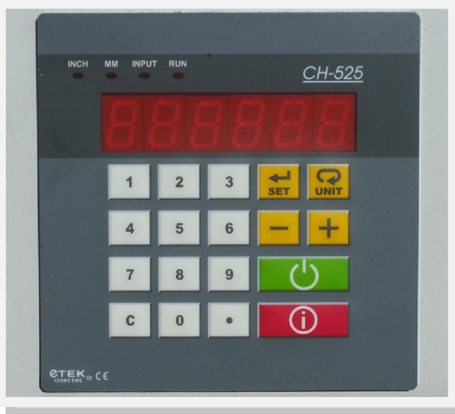
Bediendisplay zur Einstellung der Materialstärke