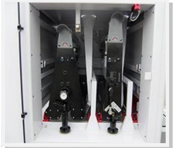
Kombi Aggregat Walze / Schuh (links) Kalibrierwalze(Stahl) (rechts)