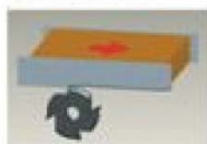
Single side straight