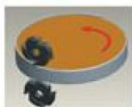
Double sides radi arch